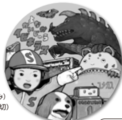
特製ステッカーは 直径12cmの 特大シール!